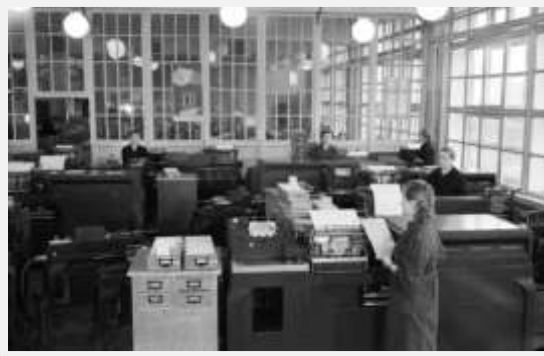
Машинносчетная станция 1959г.

Итоги переписи по Кемеровской области, которая теперь уже имела статус самостоятельного субъекта страны, за двадцатилетний межпереписной период показали рост численности населения с 1,7 млн. человек до 2,8 млн. человек. Доля городского населения увеличилась и достигла 77%. Война принесла с собой не только большие людские потери, но и репрессии, эвакуацию. Эти обстоятельства значительно повлияли на численность и состав населения Кузбасса.