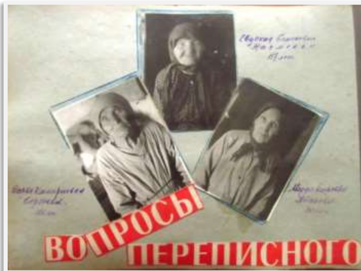
Страница Отчета, посвященная долгожителям

Содержание Отчета демонстрирует всю ответственность и креативность, с которой работники на местах относились к своим обязанностям по организации и проведению переписи. Такое отношение к переписной работе было характерно для всей страны. В Отчете представлено много фотографий, рассказывающих о проделанной «политико-массово-разъяснительной работе» среди разных групп населения: на предприятиях, в учреждениях, домах культуры.