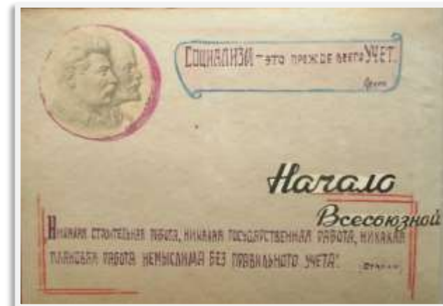
Отчет Прокопьевской городской инспектуры Нархозучета Новосибирской области о проведении Всесоюзной переписи населения

По итогам переписи 1939г. Россия еще оставалась «сельской» страной (доля сельского населения составляла 66,5%). «Городской» она станет по итогам следующей переписи. Кузбасс же был «городским» уже тогда (доля городского населения составляла 55%).