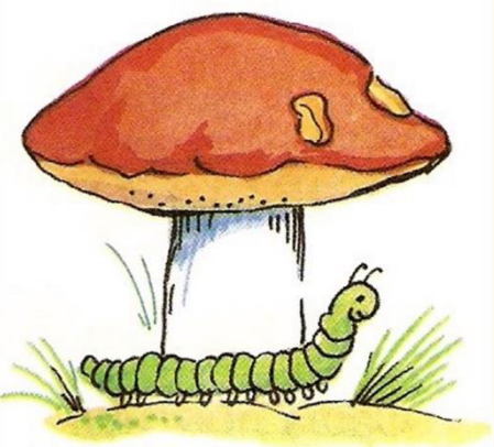
гусеница ПЕРЕД грибом