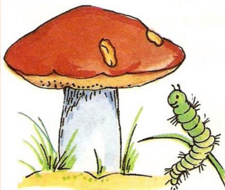
гусеница ОКОЛО гриба