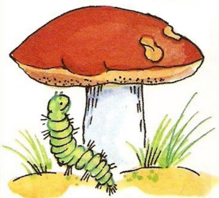
гусеница ПОД грибом