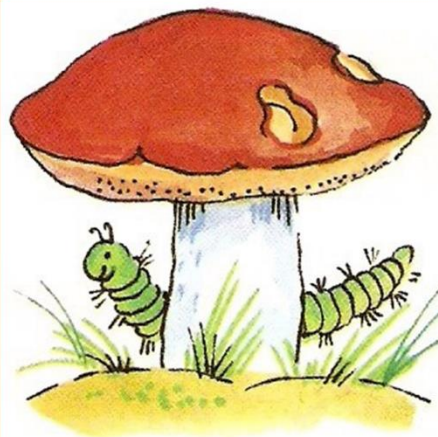
гусеница ЗА грибом