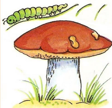
гусеница НАД грибом