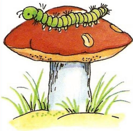
гусеница НА грибе