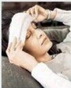
Положение пострадавшего: голова выше туловища

В этом случае, если у вас появилось подозрение на тепловой или солнечный удар, перенесите ребенка в прохладное затененное помещение и разденьте его. Можно обмахивать ребенка, чтобы создать прохладу.